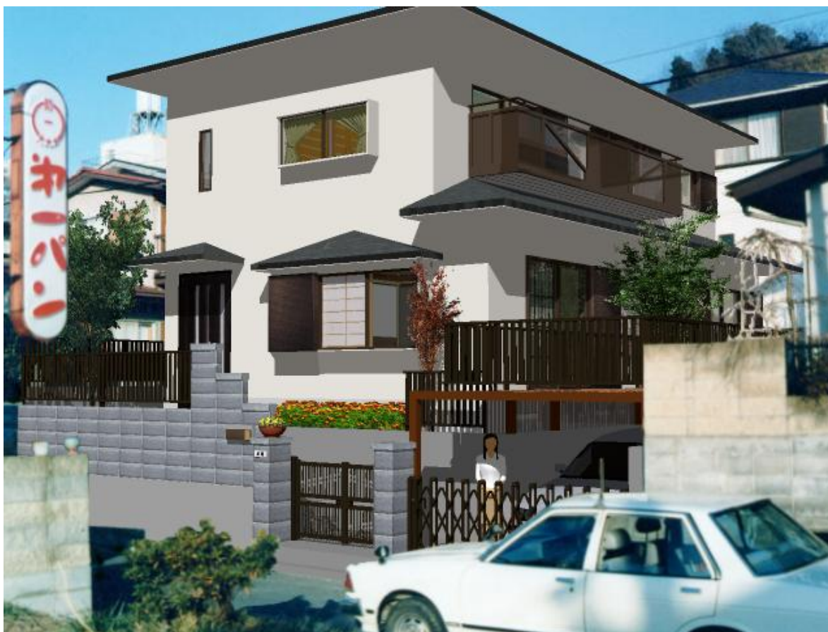
前景の貼付け、細かい修正で完成