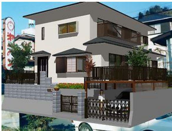
レンダリング画像

レンダリング結果に満足できれば前景を付け加えます。 グラフィックソフト を使い背景の原画より 前景のみ を切り出しレンダリング画像に 合成 します。 細かい修正を加え完成です。